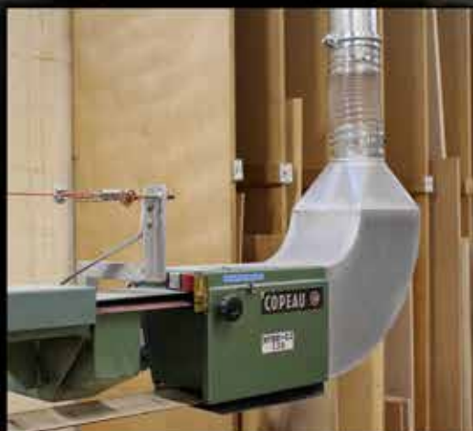
Cape de ponceuse longue bande avec buses de nettoyage de la bande abrasive par air comprimé. En partenariat avec la CARSAT.