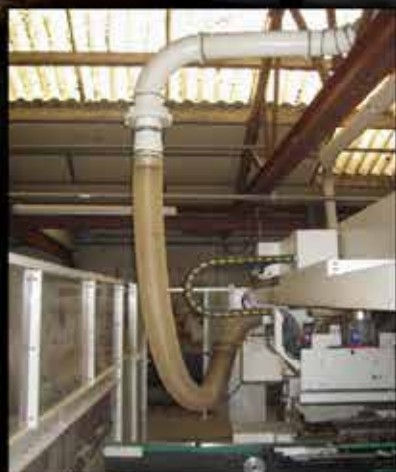
Raccord tournant Evite les torsions des flexibles et améliore leur longévité.