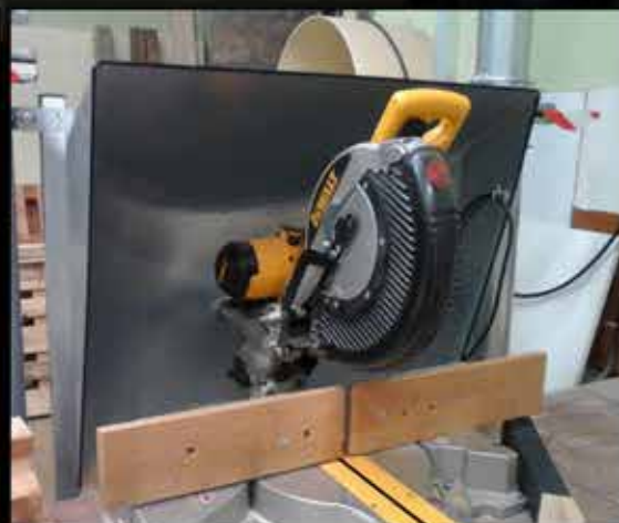
Capot sur-mesure pour aspirer les poussières de coupes émises par la scie radiale.